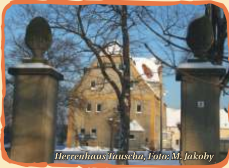
Herrenhaus Tauscha

In Tauscha lohnen sich Besichtigungen von Herrenhaus und Kirche. Den Altar hat Johann Joachim Kändler 1745 geschaffen.