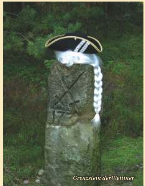
Grenzstein der Wettiner

Laußnitzer Heide: 1564 erwarb Kurfürst Moritz von Sachsen das Waldgebiet vor allem für die höfische Jagd. Zu dieser Zeit bekam die Laußnitzer Heide ihre erste jagdliche Wegeeinteilung. Vom Mittelpunkt der Heide (Grüne Säule) verliefen acht Flügel sternförmig bis an ihre Außen Grenzen. Durch die unregelmäßige Streu-, Gras- und Weidenutzung und den intensiven Jagdbetrieb befand sich der Wald im 18. Jahrhundert in einem katastrophalen Zustand. Nach einer ersten Waldinventur 1816 durch Heinrich Cotta, begann 1820